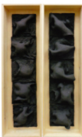
日象工芸大賞 渡邊 みどり(工)