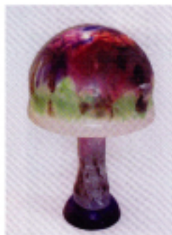
環境大臣賞 今井 弘 (工)