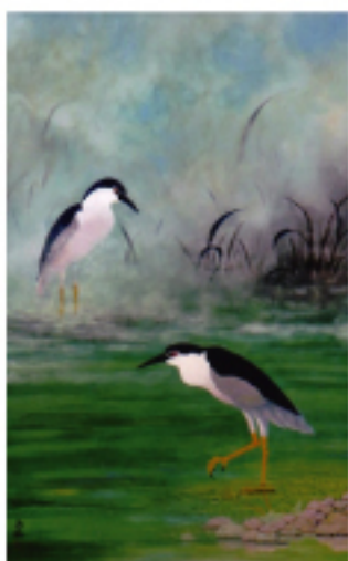
日象大賞 清水春海 (日)